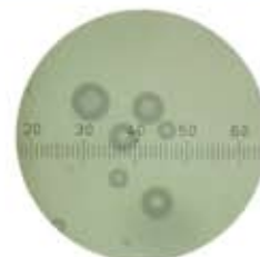
約0.003ミリの超微細な気泡

※マイクロバブルとはファインバブルのうち、直径1μm以上100μm未満の気泡の名称です。(ISO国際標準規格)