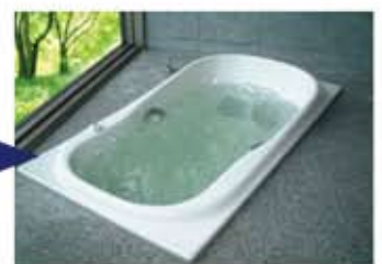
マイクロバブル(MB)とエアレスジェット(JET)の切り替えはワンタッチ